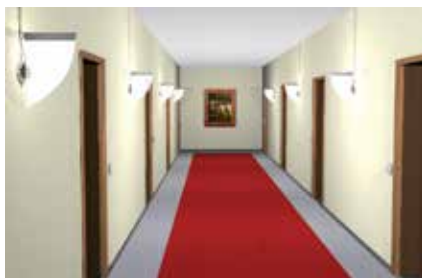
Installazione di plafoniere in serie