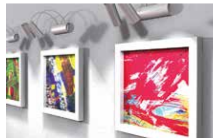
Installazione di plafoniere in serie