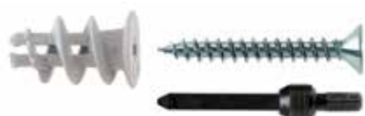
Fissaggio per cartongesso GKS con vite